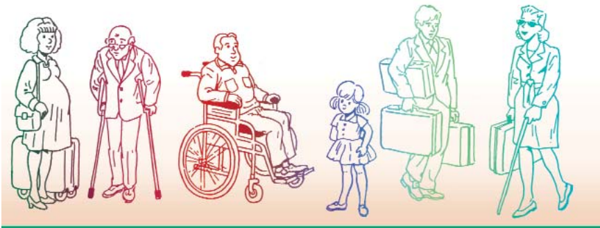
Cada turista tiene necesidades especiales

El turismo y el ocio son elementos básicos de la vida cotidiana de nuestra sociedad. Constituyen un derecho al que sin embargo numerosas personas, por motivos discapacidad, edad u otras razones, no pueden acceder o lo hacen con grandes dificultades debido a que las infraestructuras y equipamientos no presentan las condiciones de accesibilidad adecuadas a sus necesidades.